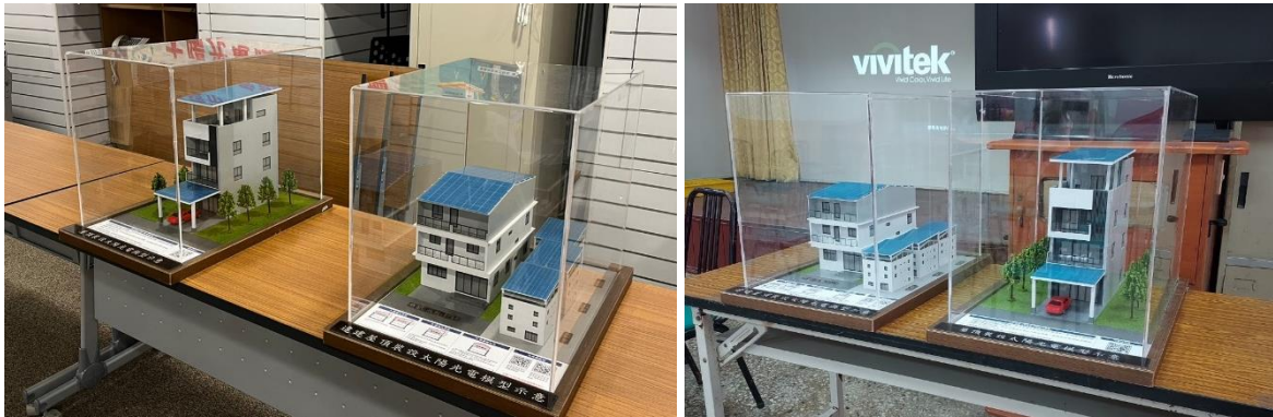
圖 1、裝設光電設施模型示意圖

預計現場將擺設屋頂型太陽光電設施模型，除能吸引有興趣之民眾主動觀看及了解外，於說明會上也會用實體模型向民眾解說太陽光電系統的空間布局，藉由此方式，再搭配簡報說明，除可讓民眾了解太陽光電相關資訊及申設內容外，更能夠有完整具體的概念。